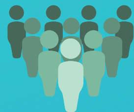
Таблица 1 Графа 3

Указывается среднесписочная численность работников (без внешних совместителей и работников несписочного состава) за октябрь месяц в целом по организации (обособленному подразделению) и отдельно по мужчинам и женщинам. Среднесписочную численность за октябрь определяют путем суммирования работников списочного состава (без работников, находящихся в отпусках по беременности и родам, в связи с усыновлением новорожденного ребенка и отпуске по уходу за ребенком, а также без обучающихся (поступающих) в образовательных учреждениях, которые находились в отпуске без сохранения заработной платы) за каждый день октября, включая праздничные и выходные дни и деления полученной суммы на 31.